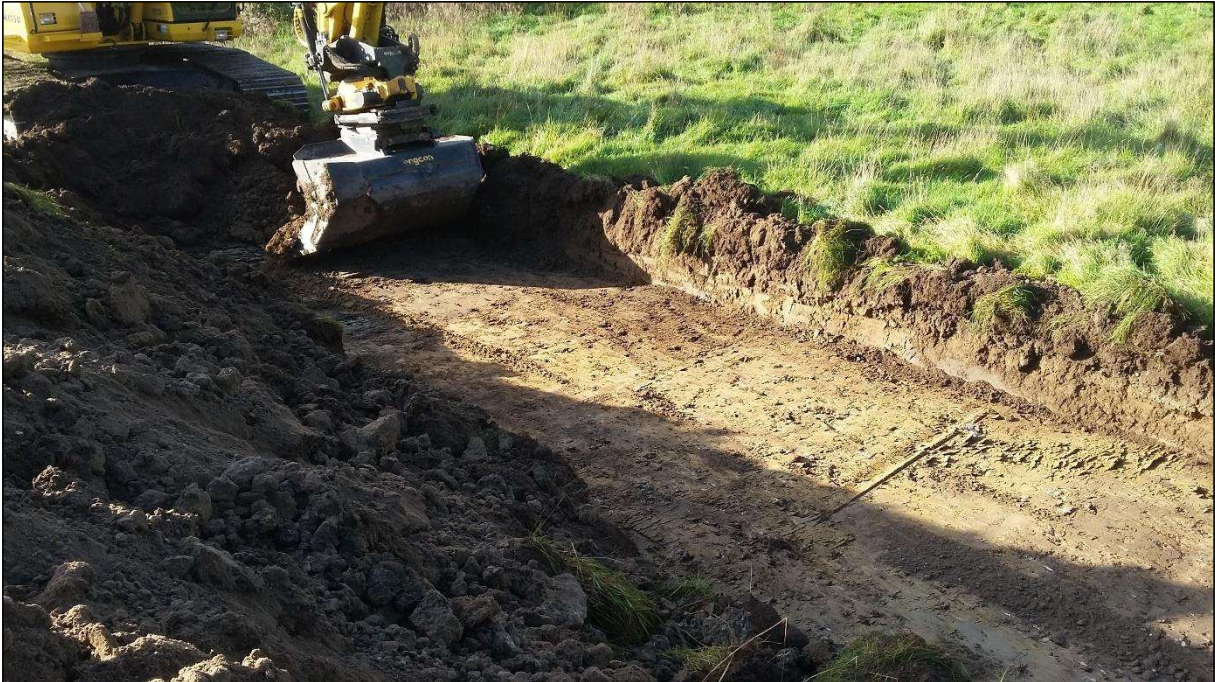
Figur 4: Undergrunden bestod af let sandet ler, flere steder med mange sten og indslag af grus.

Kærsmindeområdet ligger på et plateau, der mod vest skræner let ned mod Oust Møllebæk. Undergrunden bestod af let sandblandet ler med en del sten. De fritlagte grøfter blev meget fedtede og glatte i vådt vejr.