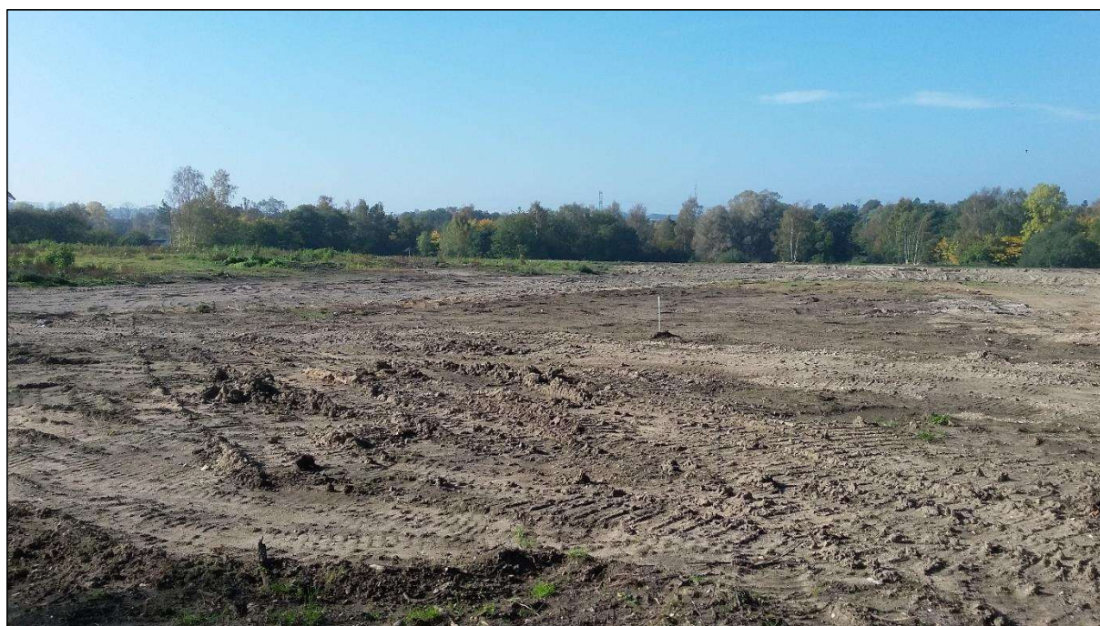
Figur 3: Den del af området, hvor der før nedrivningen, var bygninger og vejadgang. Bagerst i billedet til højre ses resterne af nyttehaverne. Set fra øst.