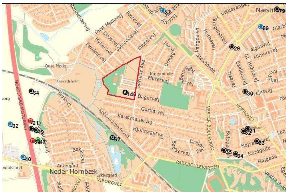
Fig. 1 MOE932 Kærsmindebadet ses markeret med rød strek og med nr. A149 ved Gørrilds Allé

Forud for et større byggeprojekt på grunden, hvor det nu nedlagte Kærsmindebad har ligget, ønskede Randers Kommune en forundersøgelse på arealet. Der er ikke tidligere registreret fund eller foretaget udgravninger på området. Umiddelbart syd for området er der tidligere fundet en tysk sølv mønt fra senmiddelalderen (-62). Ved Oust Møllevej vest for Kærsmindebadet er der undersøgt bevarede fortidsminder fra flere forhistoriske perioder. Bl.a. kulturlag og flint fra den tidlige del af bondestenalderen (-21, -24), samt en hustomt og kogestensgruber fra bronzealderen (-47). Nordøst for planområdet er der fundet en jordfæstegrav fra ældre jernalder samt spor efter bopladsaktivitet fra samme periode (-37, -89). Desuden er området øst for Kærsmindebadet præget af gravhøje, der ikke er dateret.