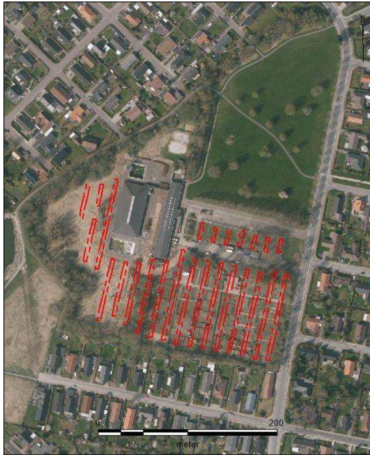
Figur 5. De 25 omtrent nordsyd-gående søgegrøfter.

Det var kun muligt at anlægge søgegrøfter på den vestlige og sydlige del af det i alt 8,3 hektar store lokalplansområde, da parken nord for Kærsmindbadet skulle bibeholdes, og arealerne hvor svømmebadet, tilkørselsveje osv. var fjernet, og derfor ikke længere havde nogen arkæologisk relevans.